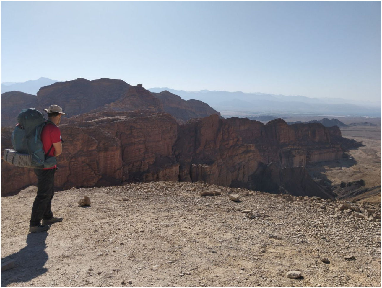
בסוף המקטע השלישי , אני הולך לבאר אורה למכולת. הכל טוב